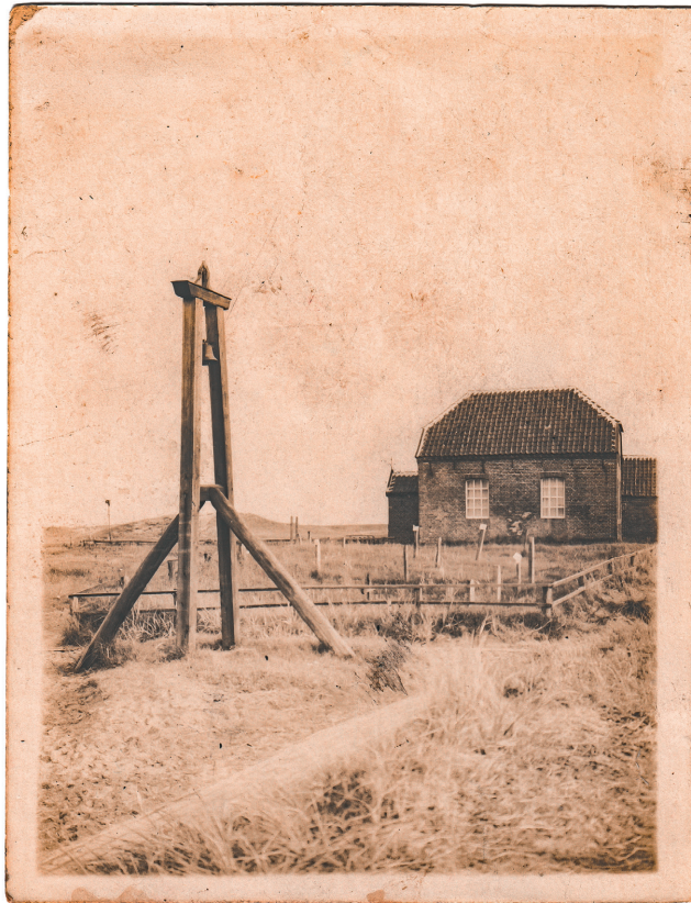
INSELGLOCKE UND ALTE INSELKIRCHE MIT DEM ALTEN FRIEDHOF, 1925